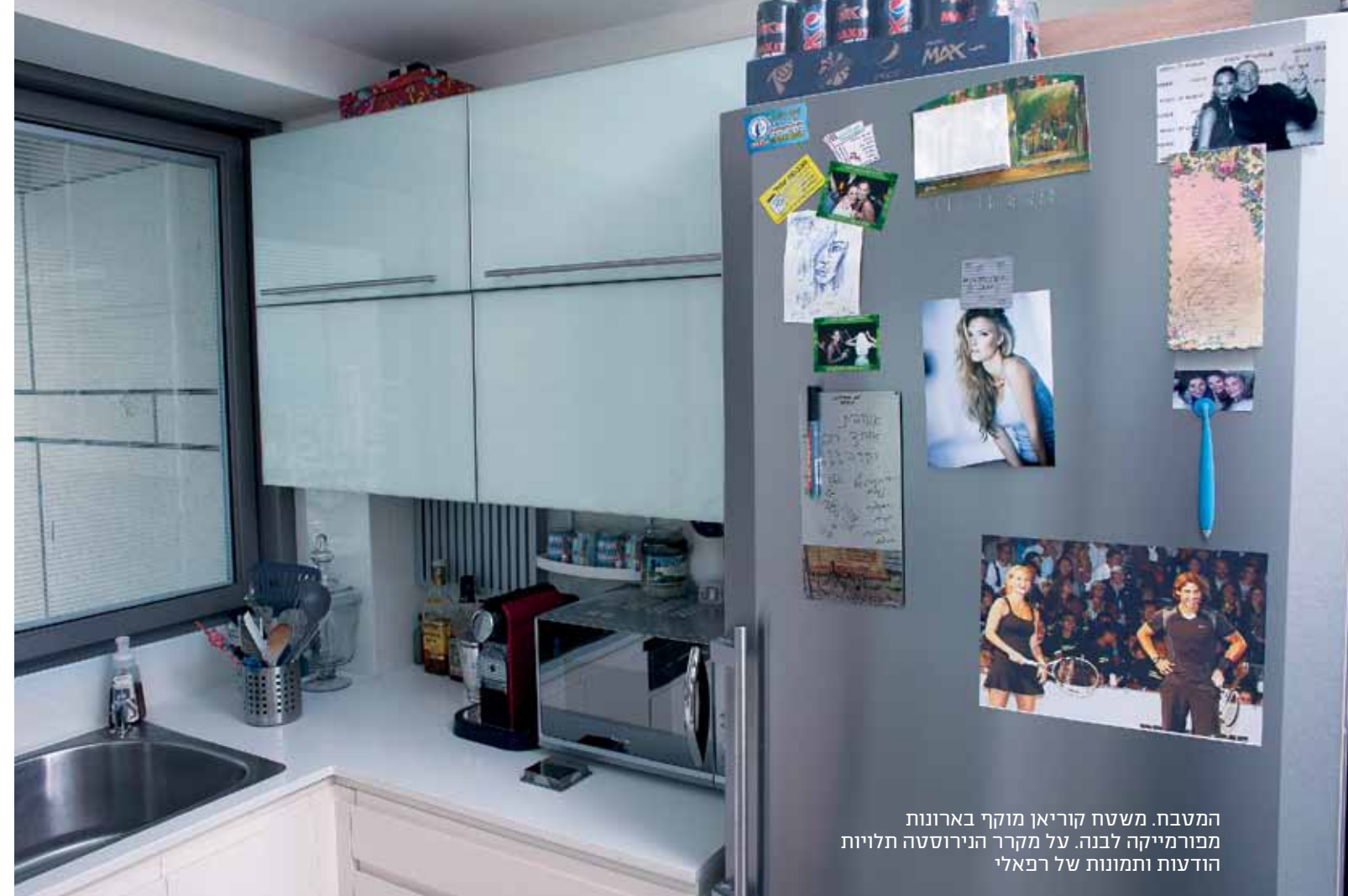
המטבח. משטח קוריאן מוקף בארונות מפורמיקה לבנה. על מקרר הנירוסטה תלויות הודעות ותמונות של רפאלי