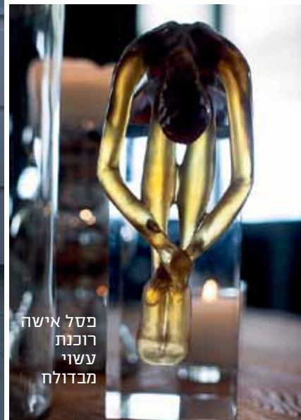
פסל אישה רוכנת עשוי מברזל