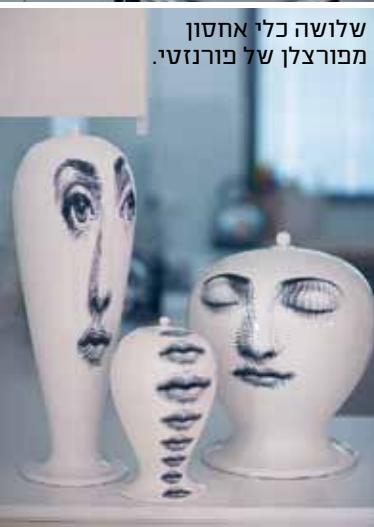
שלושה כלי אחסון מפורצלן של פורנזטי.