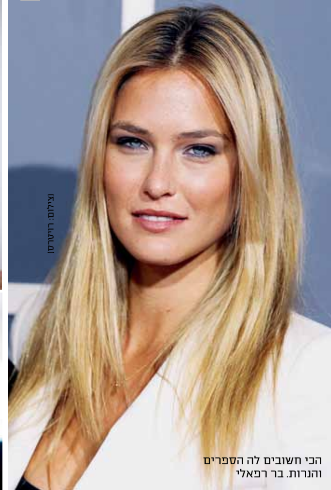
הכי חשובים לה הספרים והנרות. בר רפאלי