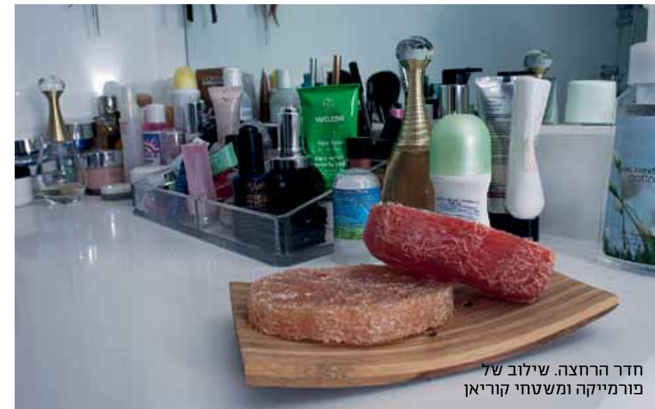
חדר הרחצה. שילוב של פורמיקה ומשחחי קוריאן