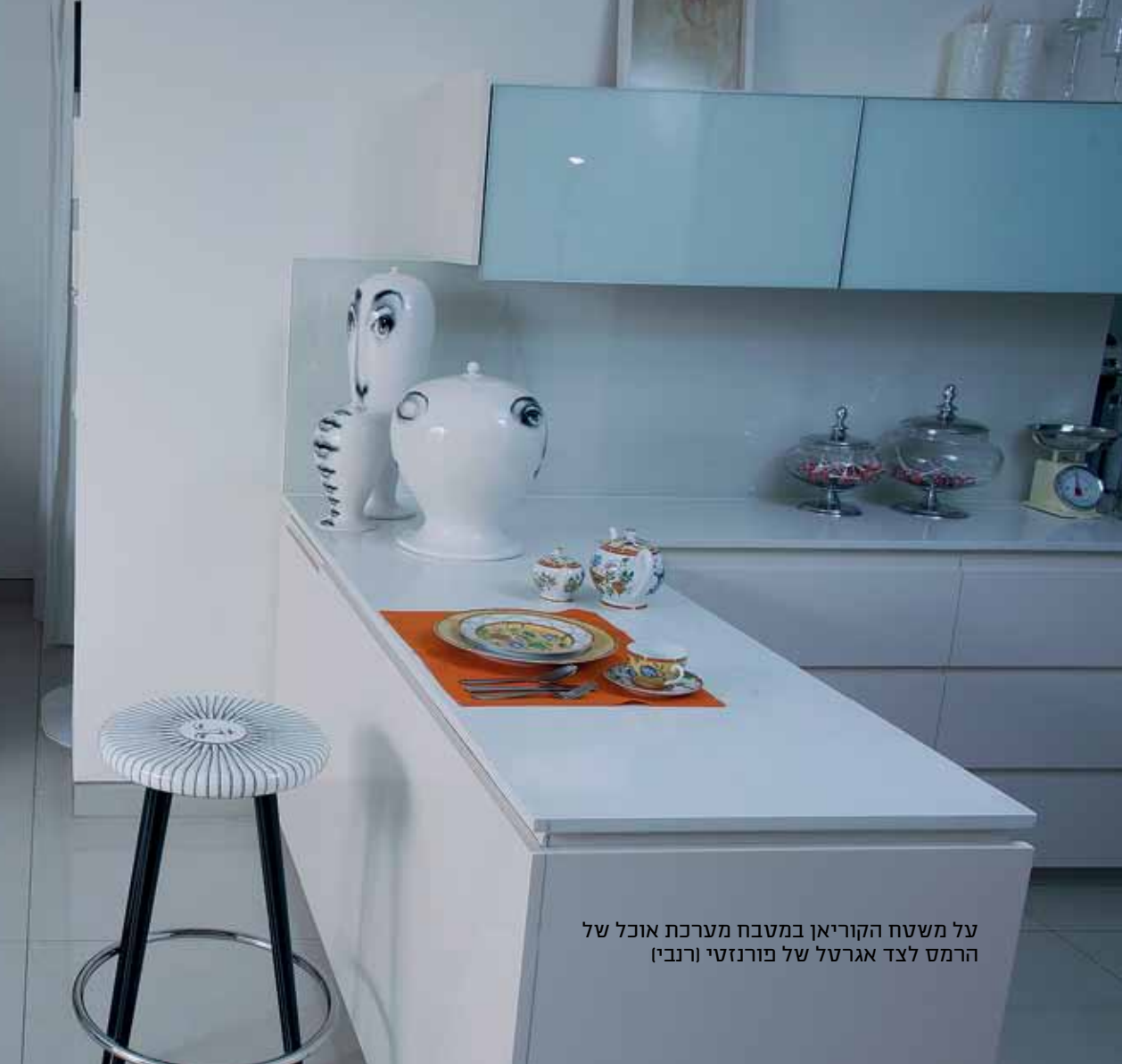
על משטח הקוריאן במטבח מערכת אוכל של הרמס לצד אגרטל של פורנזטי (רנבין)