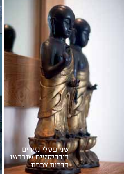
שני פסלי נזירים בודהיסטים שנרכשו בדרום צרפת