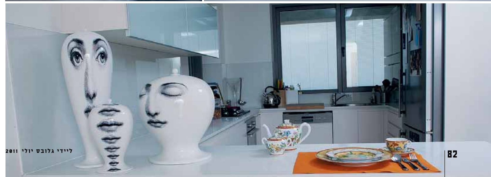
ליידי גלובס יולי 2011